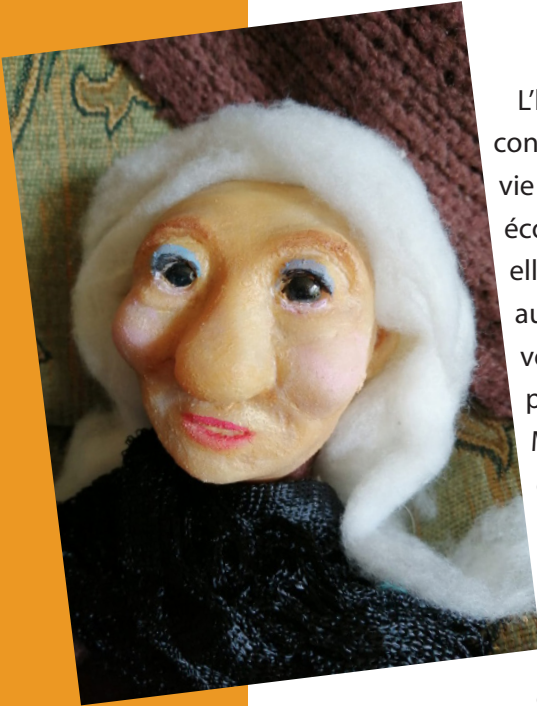
Na, marionnette à gaine

Il faut trouver une autre solution que la peur !»