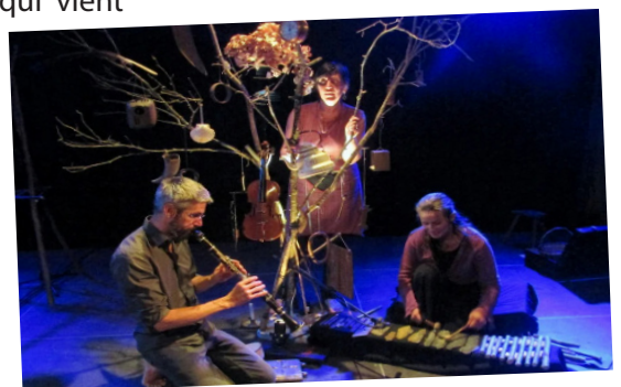
L'Arbre Akham, conte musical